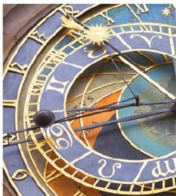
Zegar w Pradze