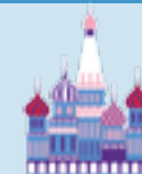
SOBÓR WASYLA BŁOGOSŁAWIONEGO

Budowa bazyliki w Barcelonie, w Hiszpanii rozpoczęła się w 1882 r. pod dyktando słynnego architekta Antonio Gaudiego. W tamtym czasie finansowana była wyłącznie z darowizn, dziś jest kontynuowana również dzięki wpływom z biletów wstępu. Jej konstrukcja postępuje bardzo wolno. Ma zostać ukończona w 2026 r.