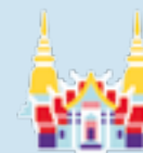
WIELKI PAŁAC KRÓLEWSKI

Mierzący 21196,18 km Wielki Mur Chiński nosi ślady kilku dynastii. Jego budowa, rozpoczęta za panowania cesarza Qin, w ciągu 2000 lat wymagała tysięcy ludzi, żołnierzy, chłopów i więźniów, by móc zostać ukończona.